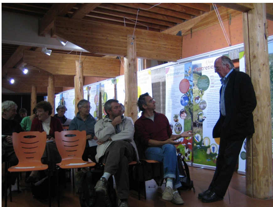
Francis HALLÉ en entretien avec des enseignants de l'Université Blaise Pascal de Clermont Ferrand, en attendant le début de la conférence