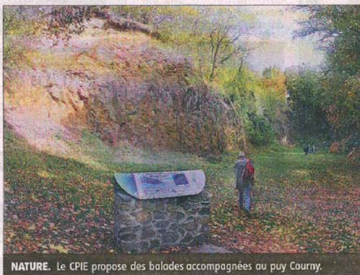
NATURE. Le CPIE propose des balades accompagnées au puy Courny.

Aujourd'hui jeudi 1 er avril. Exposition santé-habitat, centre Pierre-Mendès-France. Tout public. Animation de l'exposition, de 14 heures à 17 heures. L'exposition est visible jusqu'au 7 avril.