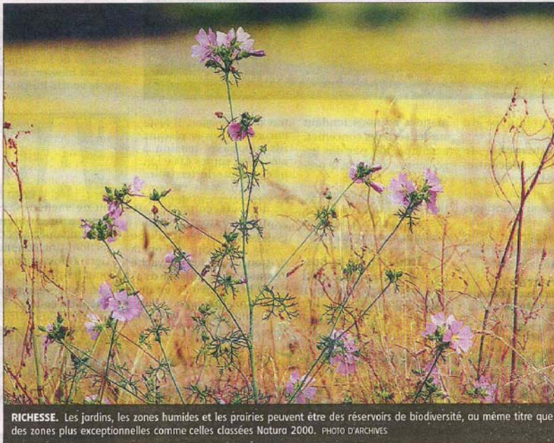
RICHESSSE. Les jardins, les zones humides et les prairies peuvent être des réservoirs de biodiversité, au même titre que des zones plus exceptionnelles comme celles classées Natura 2000.