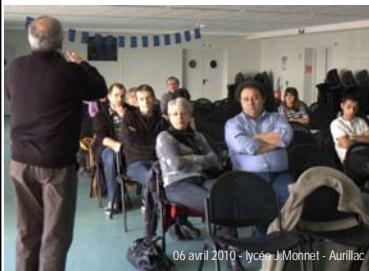
06 avril 2010 - lycée J.Monnet - Aurillac