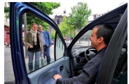
Un schéma de mobilité cohérent à l'échelle du bassin de vie est la clé d'une offre d'alternatives vraiment concurrentielles à la voiture individuelle.