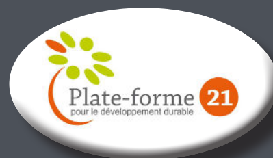
Plate-forme 21 pour le développement durable

VetAgro Sup, 89 avenue de l'Europe - BP 35 - 63370 LEMPDES Tél. 04 73 98 13 71 - contact@pf21.fr www.plate-forme21.fr